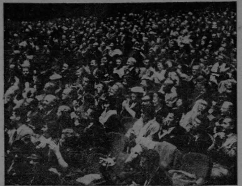
Las salas de los teatros, que se habían visto vacías en años anteriores, en México, ante la influencia del cine, vuelven a llenarse noche a noche, gracias al resurgimiento del arte teatral que en pocos años se ha desarrollado en la República. La foto nos muestra el aspecto de uno de los teatros metropolitanos durante la representación de una obra moderna.