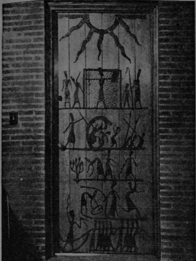
La historia de Moisés es descrita en esta decoración para la puerta de una iglesia de Chicago. Paul Aschenbach diseñó la decoración y ha recibido varios encargos de otras iglesias del país.

El escultor Paul Aschenbach, ha especializado en trabajos de escultura y talla, utilizando el hierro. Aschenbach, que es uno de los artistas de mayor renombre en los Estados Unidos afirma que perfectamente puede combinarse el arte con la utilidad, pues sus obras, de indiscutible mérito artístico, son todas aplicadas a la decoración.