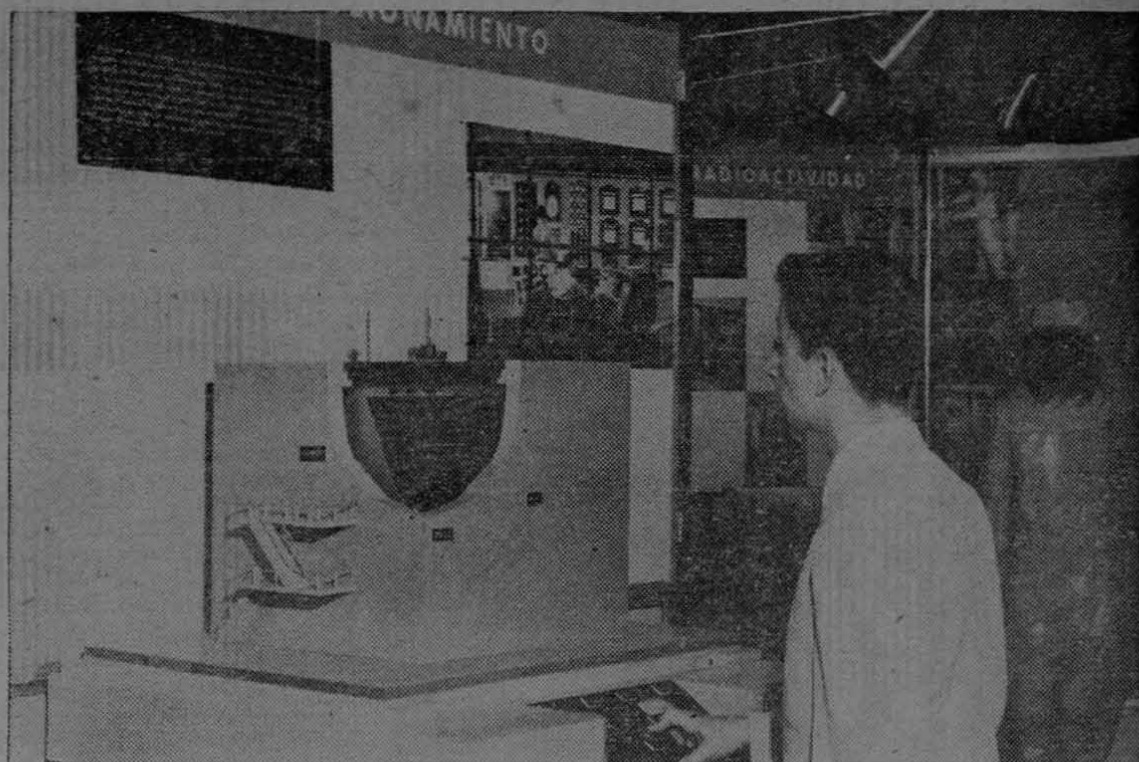
Modelo del primer reactor atómico perfeccionado que se exhibe en la Exposición de "Atomos para la Paz" y que con su funcionamiento ofrece una idea de la forma en que serán utilizados estos modernos elementos de producción de energía para beneficiar a extensas zonas del mundo, proporcionando mayor bienestar, especialmente en lugares donde en la actualidad es muy difícil establecer luz o fuerza motriz para mover industrias.